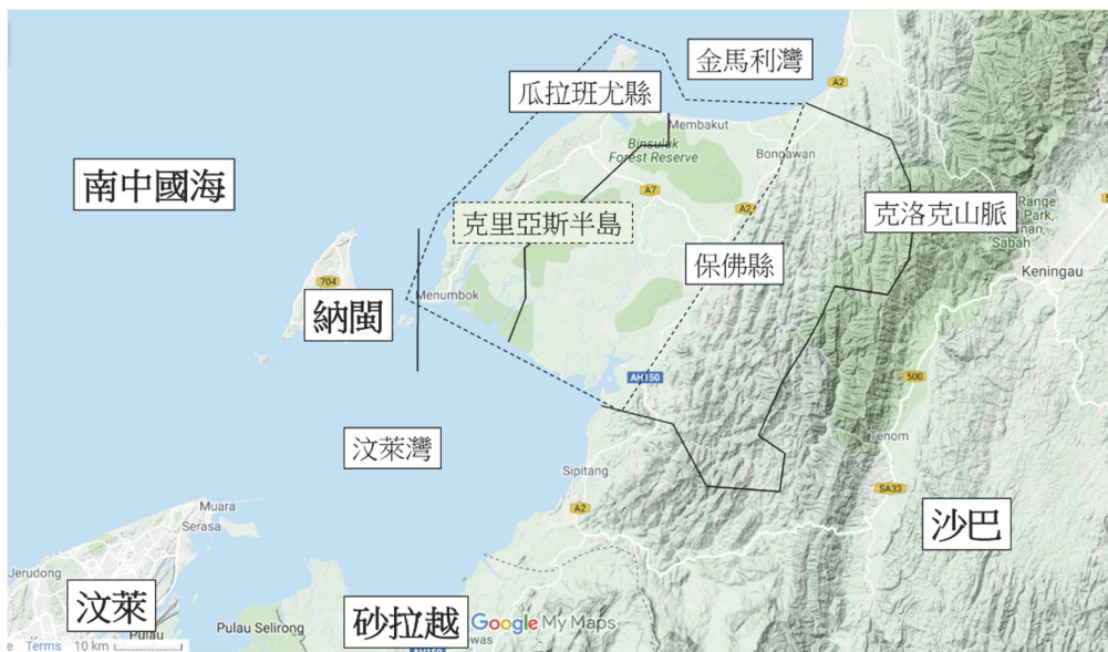
圖 2、瓜拉班尤縣的地理位置

至菲律賓南部和今沙砂的海岸（廖文輝，2019: 297）。瓜拉班尤縣大約在這時才受到汶萊的統治，一直到 1884 年 12 月才被割讓給英屬北婆羅洲特許公司 14 （以下簡稱「特許公司」）管理（Daly, 1886）。在這三百多年間，汶萊蘇丹委派當地或非當地的代理人控制河口貿易，對內陸地區的商品抽稅，同時透過伊斯蘭法維持河口的治安。以 1870 年代為例，這「殖民體系」（System Jajahan）制度裡的瓜拉班尤代理人是當地人（Ranjit Singh, 2000: 65）。