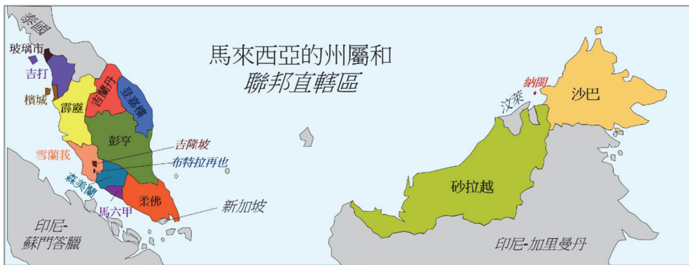
圖 1、馬來西亞沙巴州的地理位置

本文把拿督公信仰分成拿督崇拜、科拉邁崇拜、拿督科拉邁崇拜和拿督公崇拜的概念來分析田野資料的多重實踐。田野地點為東馬來西亞沙巴州（Sabah，見圖 1）的瓜拉班尤縣，時間為 2018 年 5 月至 8 月間；部分新加坡的資料來自 2020 年 2 月的龜嶼拿督科拉邁參訪。因筆者來自瓜拉班尤的隔壁縣，常在父親的引介下與當地報導人接觸，被認為是當地人。然而，筆者十五年長居在沙巴外的經驗，應足以有部分「局外人」的觀點。除了田野材料，筆者將從語言學及沙巴原住民信仰的角度出發，初步檢測拿督是否可被用來泛稱馬來人的原始信仰。